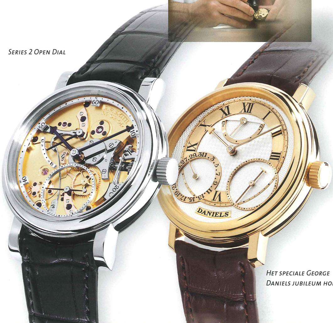
HET SPECIALE GEORGE DANIELS JUBILEUM HORLOGE