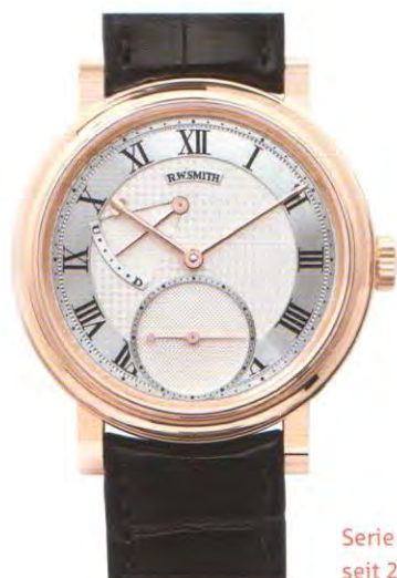
Serie 2 wird seit 2006 gefertigt.