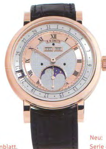
Neu: Serie 4.