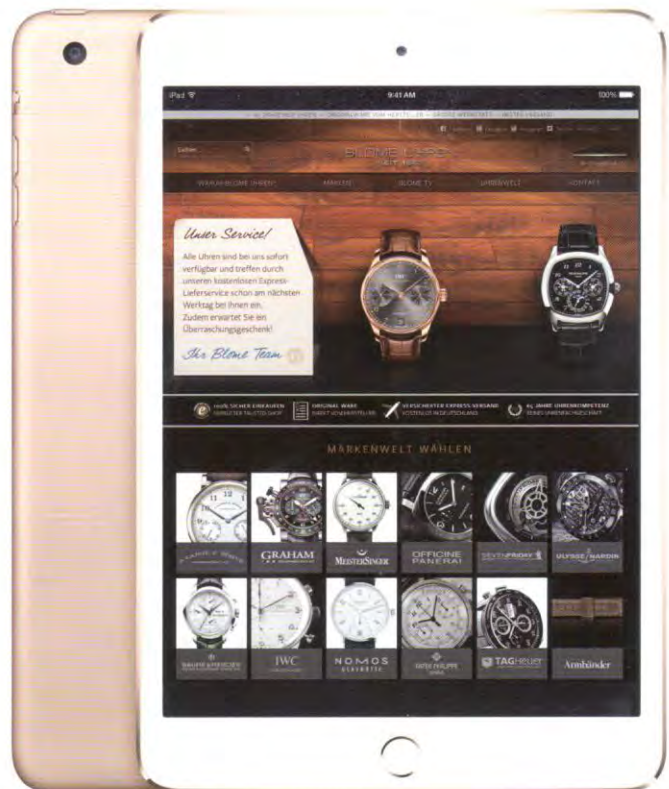
Exklusive Angebote: Online-Shop von Blome Uhren.