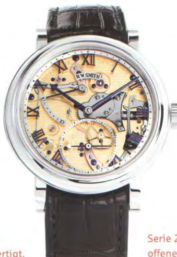
Serie 2 mit offenem Ziffernblatt.