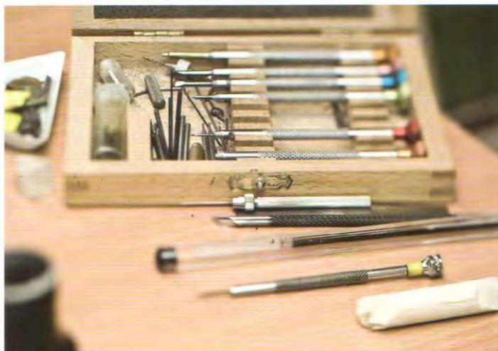
Masterpiece-Werkzeug: Federstegwerkzeuge und Stiftenkloben in allen Größen.