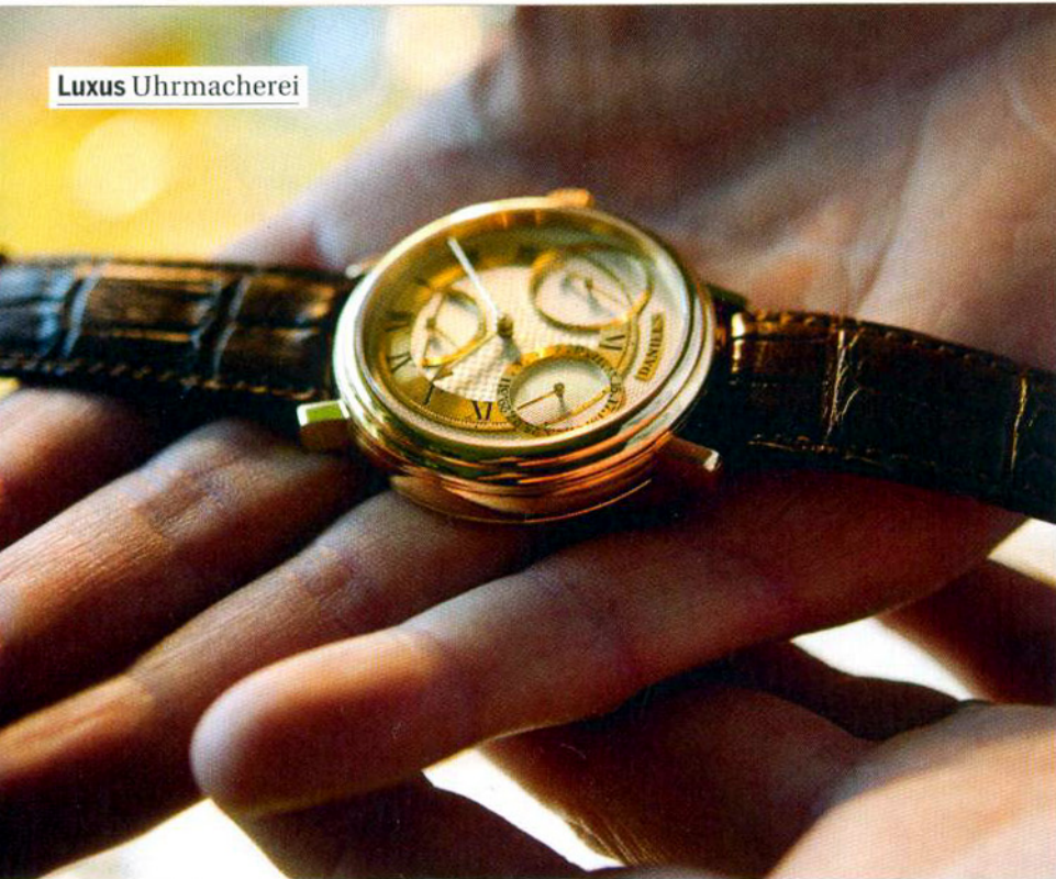
Eigentlich nichts Besonderes, oder doch? George Daniels' Kreation zum 35. Jahrestag seiner genialen Koaxial-Hemmung.