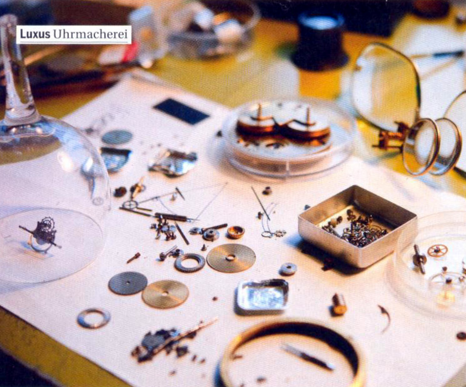
Uhrmacherisches Stilleben: Werkbank von George Daniels.